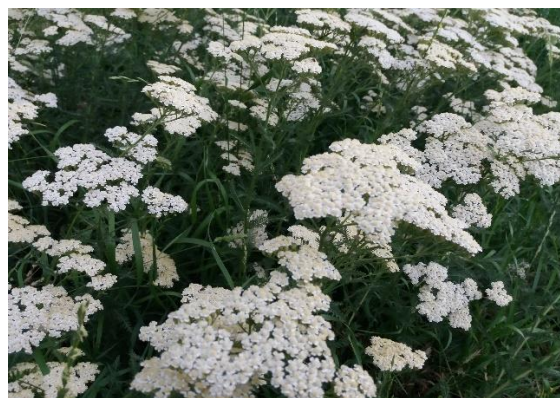
شکل ۱- الف: پیکره رویشی Achillea millefolium در مرحله تمام گل

اسانس در کرک‌های ترشحي برگ و ساقه و به ویژه گل-های سفید این گیاه تشکیل می‌شود (امیدبیگی، ۱۳۷۶). اسانس خاصیت ضدتورمی دارد که به علت خاصیت ضدباکتریایی و بهداشتی در تولید کرم‌های و