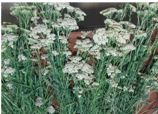
ب- پیکره رویشی گیاه برداشت شده در حال خشک شدن

آرایشی و صنایع دارویی، مداوای تورم‌های پوستی و لطافت پوست استفاده می‌شود (آپتون و همکاران، ۲۰۱۱). این گیاه چند ساله و به لحاظ ظاهری رشد علفی دارد، ساقه‌ها به ارتفاع ۳۰ تا ۹۰ سانتی متر که با کرک‌های فشرده تا کم و بیش گسترده نمدی سفید پوشیده شده‌اند. برگ‌ها سبز روشن و شکوفه‌های گل دار بومادران مقوی، معطر، ملایم، معرق، ضد اسپاسم، قاعده آور، بادشکن و قابض است و برای درمان سرماخوردگی و تنگی نفس به کار می‌رود و به عنوان مرهم و التیام‌بخش نیز مصرف می‌شود (مظفریان، ۱۳۹۶).