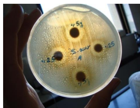
شکل ۱- فعالیت ضد باکتریایی عصاره سویا بر علیه باکتری گرم مثبت استافیلوکوکوس اورئوس در غلظت های مختلف بعد از چهار تکرار و اندازه گیری محدوده‌ی بازدارندگی