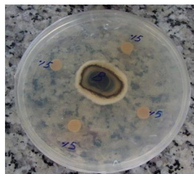
شکل ۳- فعالیت ضد قارچی عصاره‌ی متانولی دانه‌ی روغنی سویا علیه قارچ P. oryzae ، در غلظت ۰/۵ گرم بر میلی لیتر و اندازه گیری محدوده‌ی بازدارندگی

اثرات ضد باکتریایی نسبتاً خوبی داشته باشد. آرورا و همکاران دو نمونه از دانه‌ی سویا را انتخاب و بعد از عصاره‌گیری، غربالگری فیتوشیمیایی و فعالیت های ضد میکروبی را در غلظت های مختلف مورد سنجش قرار