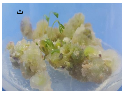
شکل 1: الف) Daucus carota ، ب) Moringa oliefera ، پ) Urtica dioica ، ت) Galega officinalis ، ث) Daucus carot