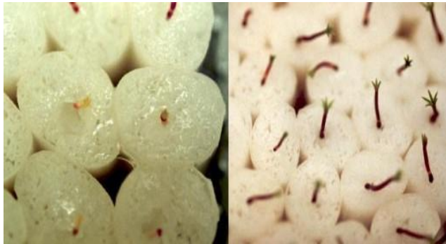
شکل ۳- بذرهای کپسوله شده با زیست لایه‌ی (Sorbarod)

کردن هیدروژل جنین های منفرد سوماتیکی یونجه (Medicago sativa) را انجام دادند و این فناوری را